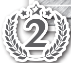
加茂・幸千ブロック