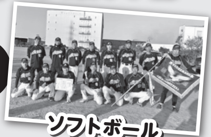
ソフトボール 【会場】箕沖球場