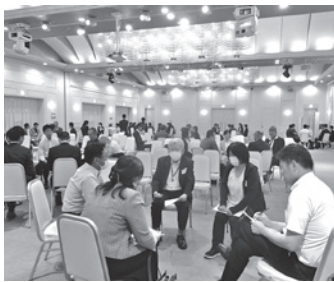
分科会にてグループ討議

り病気になるったりと大変だったこともお話しいただきました。そして、その全てを奥さまが支えていてくれたこと、一番大切なものに気付いたのは、一番最後だったとお話しいただきました。改めて家族や友人の大切さを感じる時間となりました。