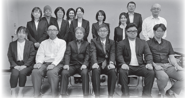
令和6年度 福山市 PTA 連合会 本部役員・事務局