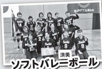
ソフトバレーボール 【会場】ローズアリーナ