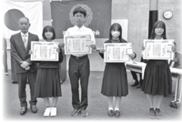
市PTA連合会定期総会

顕著な篤行(真心のこもった良い行い)があったとして 単位PTAより推薦された卒業生の方々です。